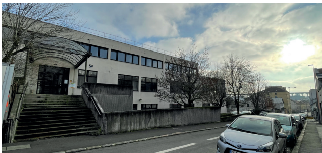
Rue Cauchy, les locaux de la CAVB seront réhabilités pour accueillir le nouvel hôtel de ville.

tendre. En réalité, ce sont les conséquences de la pandémie et les élections en 2020 qui expliquent le décalage de calendrier. Le précédent projet avait créé des crispations sur la tour signal, la localisation de la galerie d'arts plastiques ou encore la hauteur des immeubles. La crise sanitaire notamment a montré qu'il était utile de prendre du temps pour construire des aménagements compatibles avec les grands enjeux. « Nous nous inscrivons dans le courant de la « slow démocratie ». Ce n'est pas grave de prendre son temps, explique Sophie Lericq. Nous apprenons des expériences passées. Par exemple en termes de hauteur, on voit bien que le bâtiment à l'angle Barbusse/Ronsard n'est pas adapté à ce type de quartier. Ralentir, c'est aussi