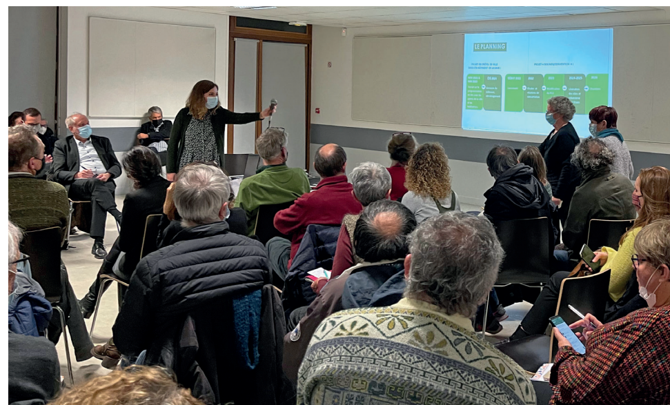
La parole sera donnée à la population tout au long du projet, car la concertation en est un élément-clé.

meuble et s'inscrit dans une volonté de créer des espaces communs, où la population puisse circuler et se retrouver, avec des lieux adaptés aux besoins des enfants, par exemple. « Nous femmes, on veut pouvoir se promener librement dans l'espace public », a dit une habitante, rejoignant ainsi la municipalité. Pour que le projet « relie et rassemble », la concertation en sera un élément essentiel, comme l'a souligné Hélène Peccolo, première adjointe, chargée de la transition écologique.