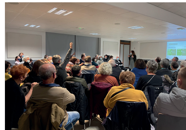
De nombreux points ont été abordés par les Arcueillais-es présents à la réunion.

Ce changement de scénario a ému plus d'un·e participant·e à la réunion publique. « Cela fait prendre un retard considérable au projet », a-t-on pu en-